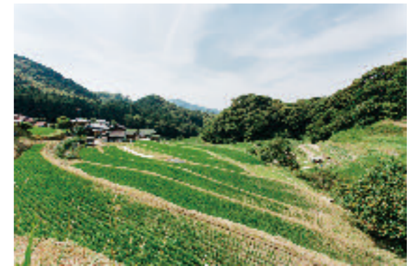
まちの1年間の様子を撮影。行政の広報誌やHPなどに使用。：福岡市那珂川町（現在 那珂川市）