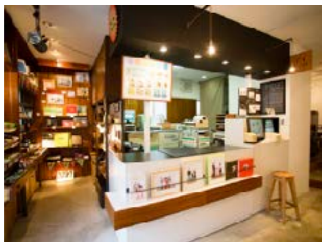
写真の現像・プリント・雑貨の販売。プリントは好みの色味をオーダーすることができる