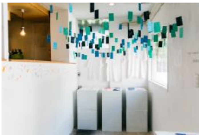
ギャラリーとして展示・販売ができるスペースをレンタルしている。作品展示、販売：ジョージ・ネルソン