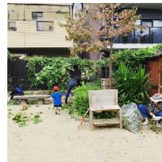
区役所から任され、公園を管理している。 公園の清掃は毎日行ない、 定期的にイベントなども開催している。