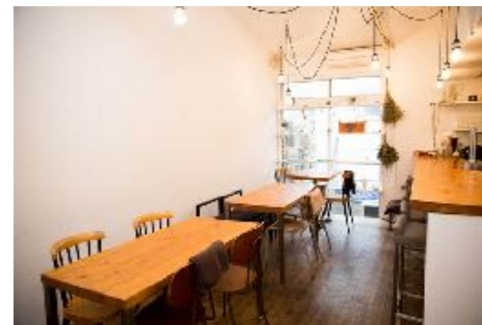
スペースをシェアしているレストラン「トレネ」 飲食ができ、イベントや催しも開催されています