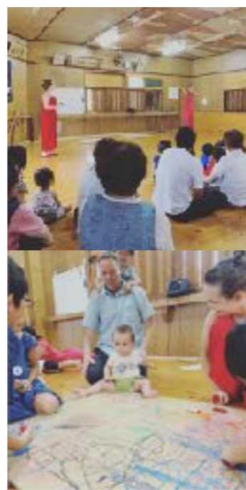
オランダから コッポッターズ