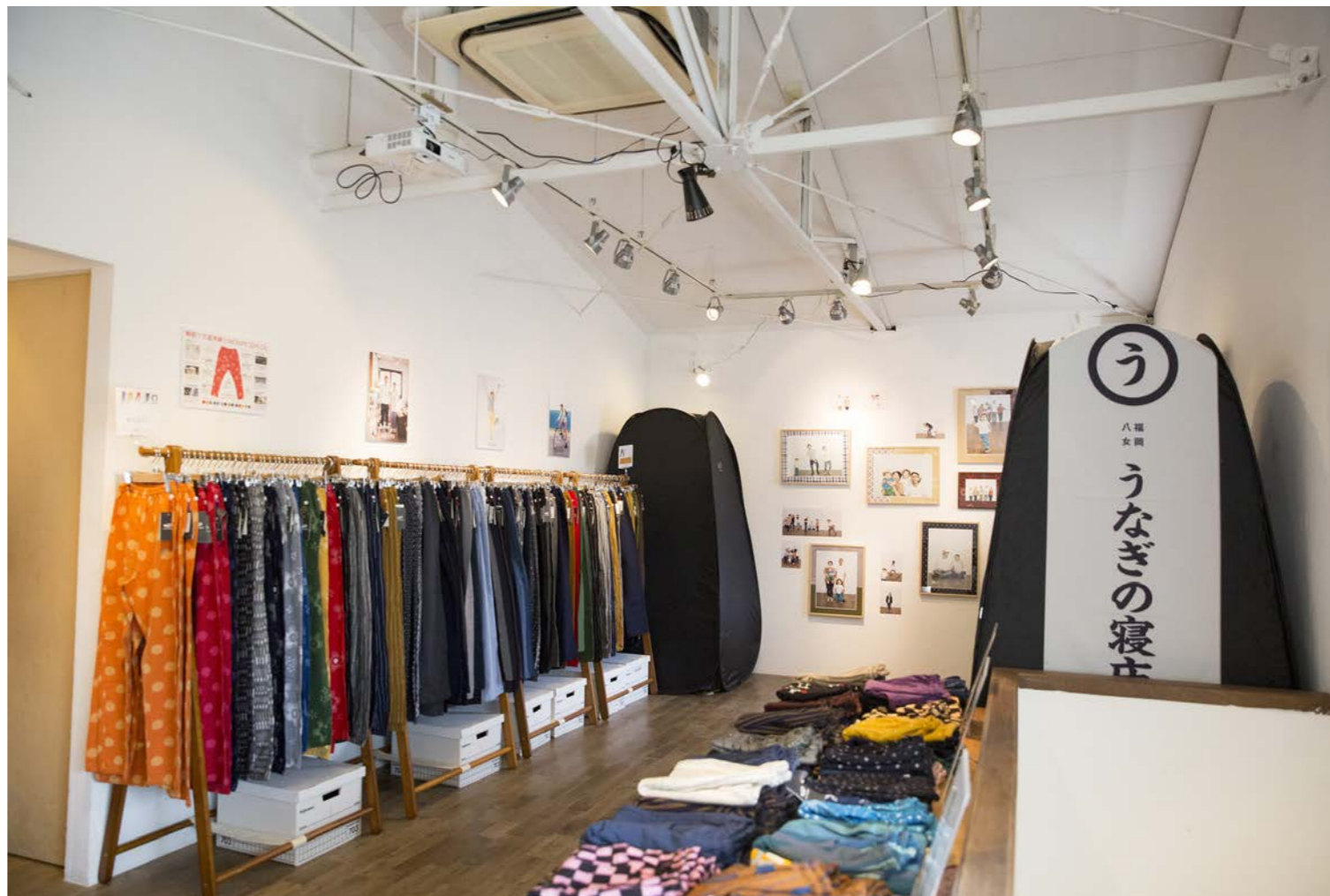
ポップアップショップ：うなぎの寝床