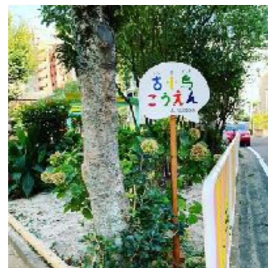
公園の看板をオリジナルで制作