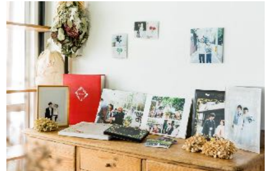
家族撮影やウエディング撮影などを行い、そのツールまでデザインしている。大切な時間を撮影し、生み出し、手に渡るまで全ての工程を自分たちで行う。