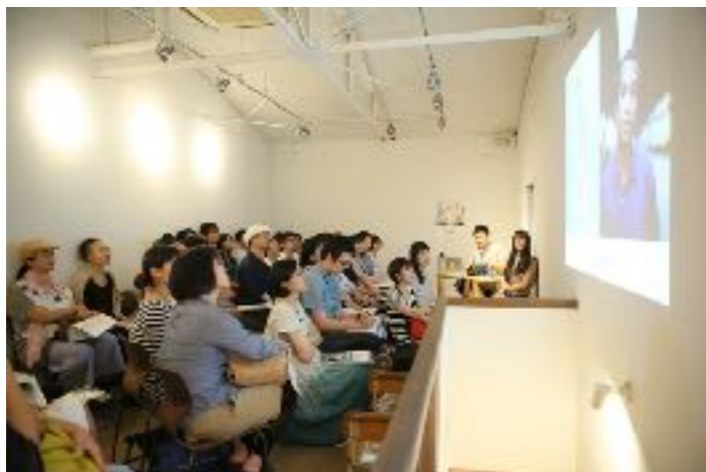
トークイベント：写真家・西山勲