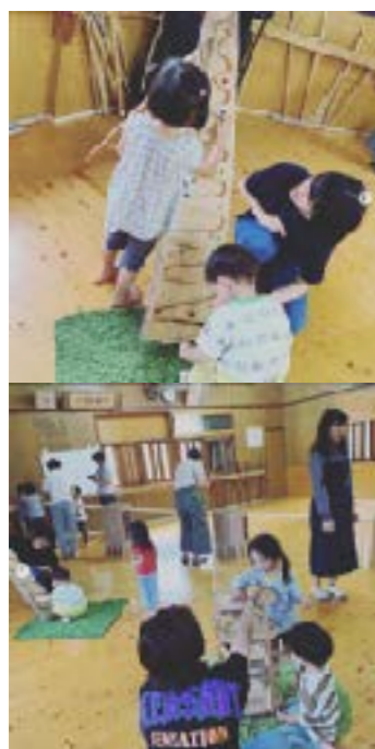
ビー玉ころがし Have a fun!